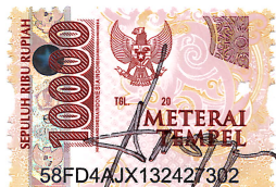
Dedi Djajasastra Direktur Utama